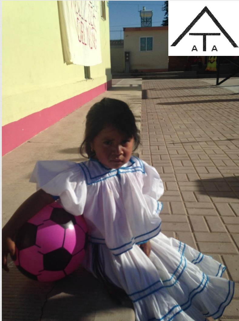
ASENTAMIENTOS TARAHUMARES, A.C. Né Bowerá Onorúame